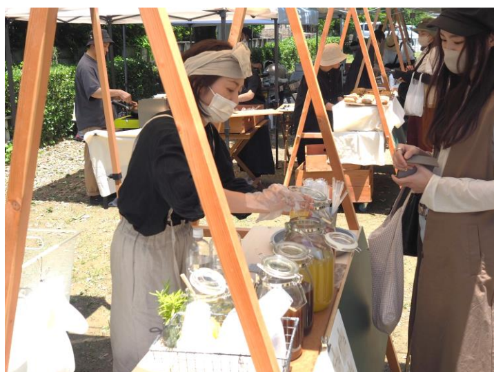
自社主催のマルシェにてモニターテストシーン①