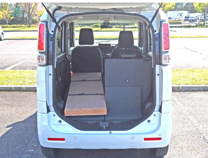
軽自動車に積み込んだ様子