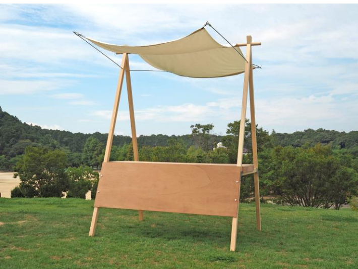
組立式マルシェ屋台「misekko」(組立時)