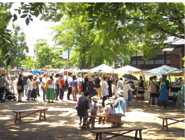
自社主催のマルシェにてモニターテストシーン②